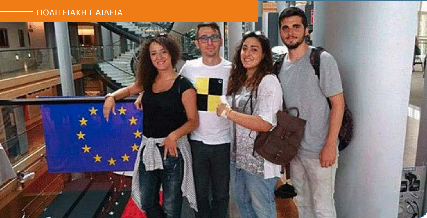
Εικόνα: Η Inter Alia Ελλάς, μέρος στο European Youth Week