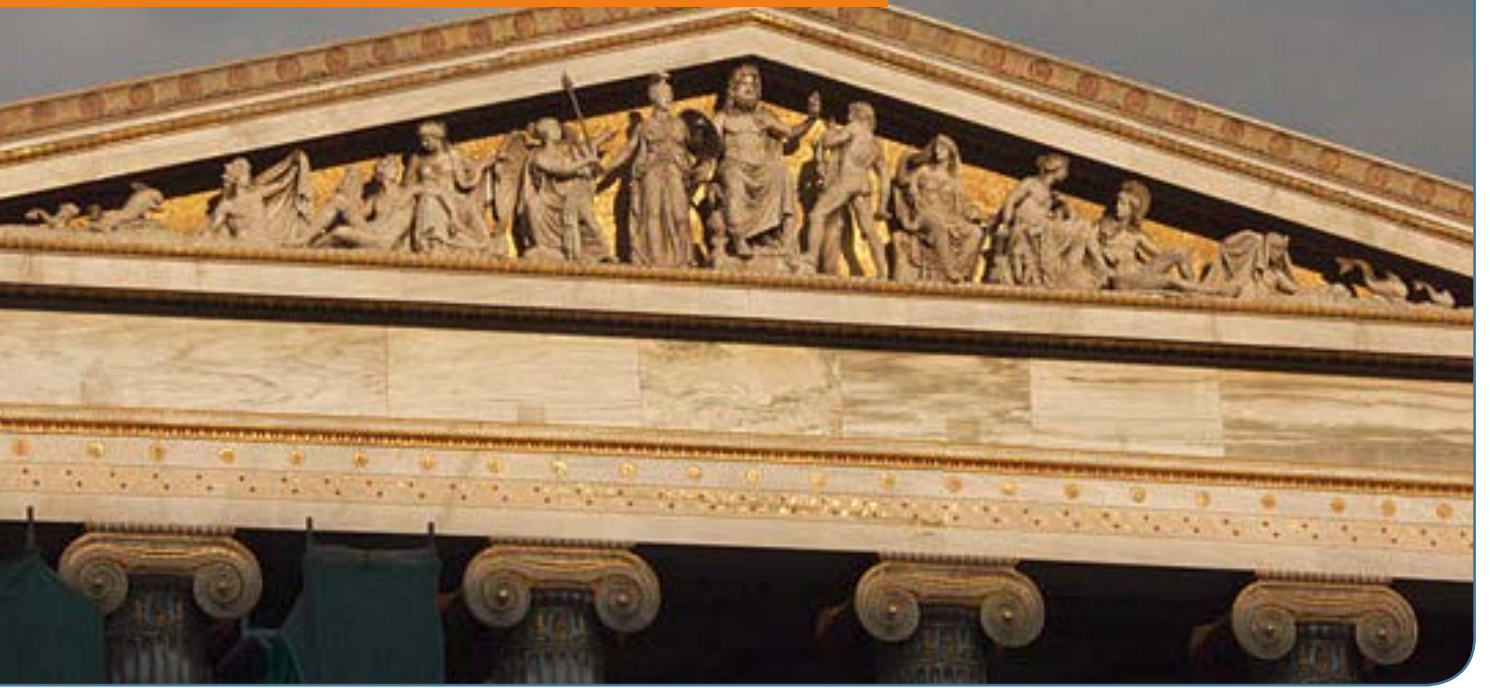
Εικόνα: Τηλέμαχος Ευθυμιάδης (CC) Αναστάσια Αθηνών