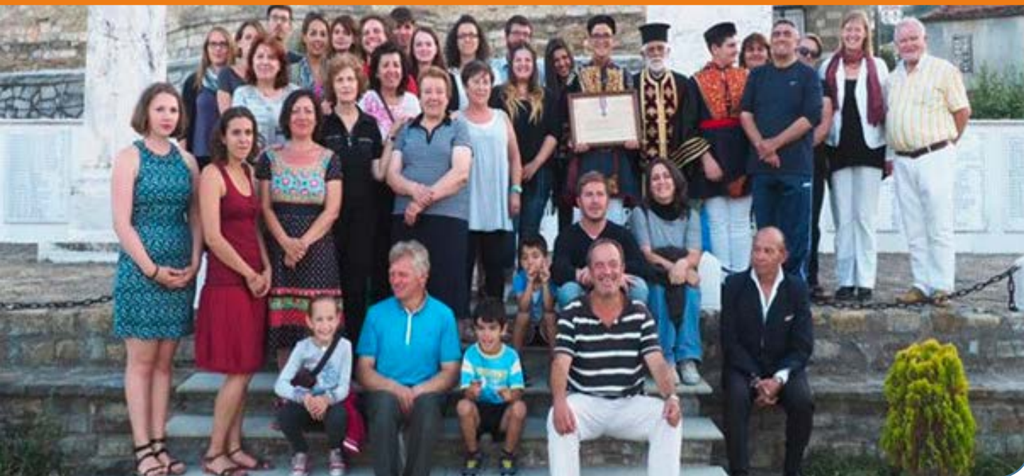
κατά τη διάρκεια τελετής στο μνημείο του χωριού Κλεισούρα