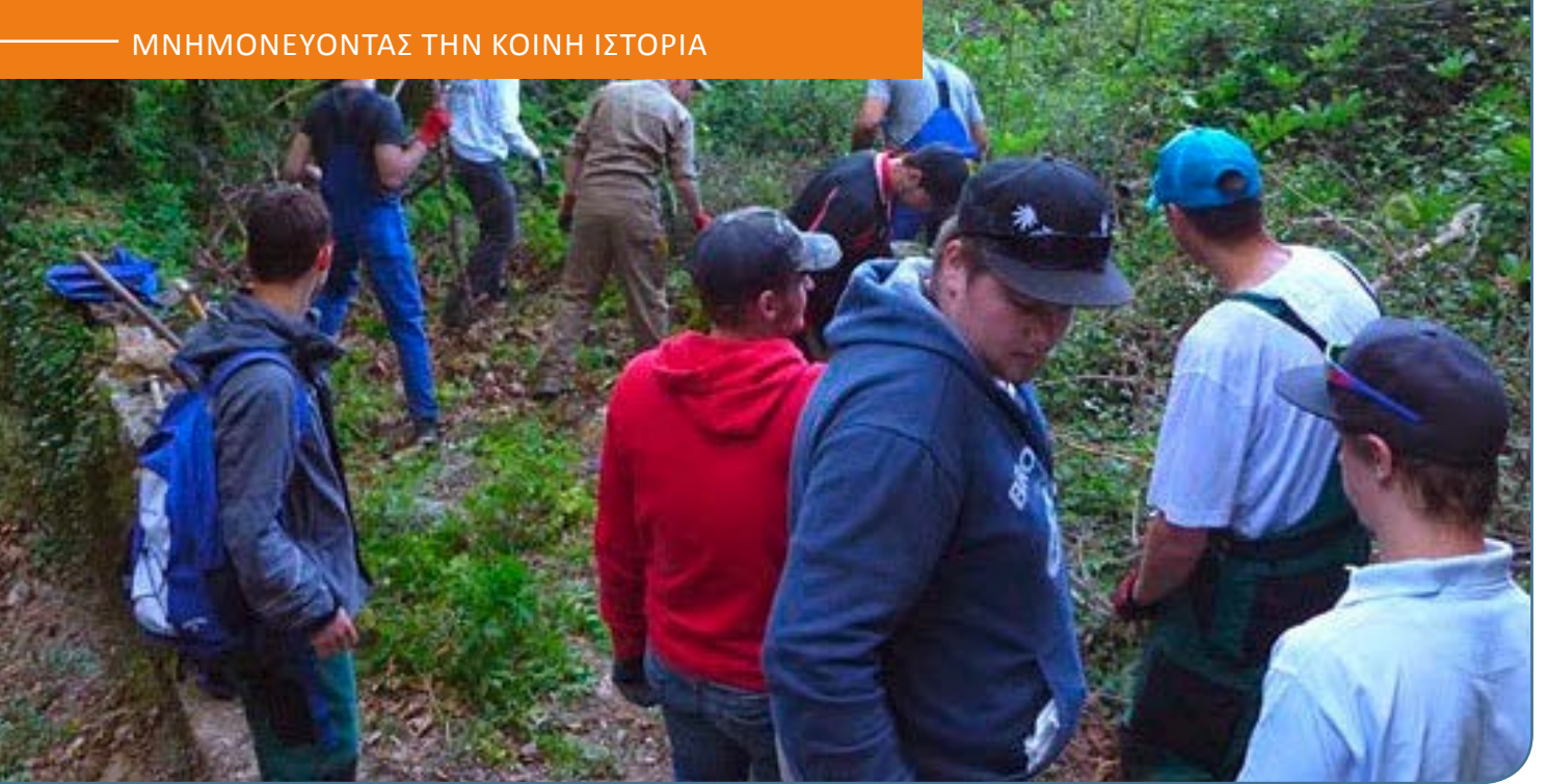
Εικόνα: Νέοι του Κέντρου Επαγγελματικής Εκπαίδευσης του Κλέβε δουλεύουν στην Άνω Βιάννο της Κρήτης