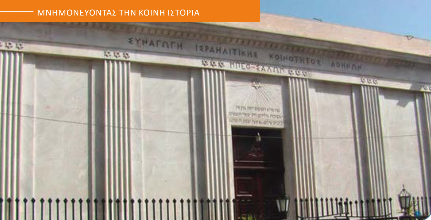
Εικόνα: Συναγωγή της Ισραηλιτικής Κοινότητας στην Αθήνα