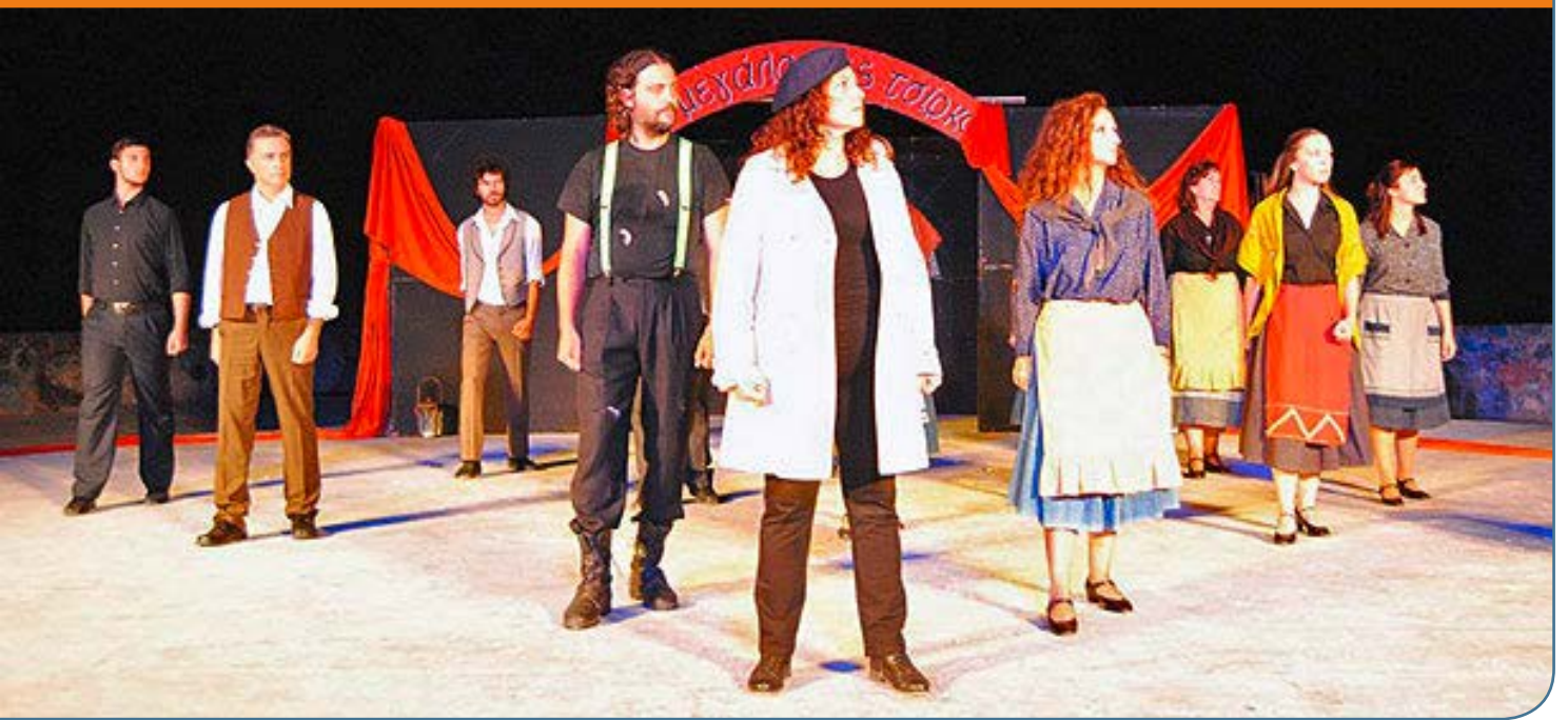
Εικόνα: Jürgen Rompf Θεατρική Παράσταση στο Δίστομο